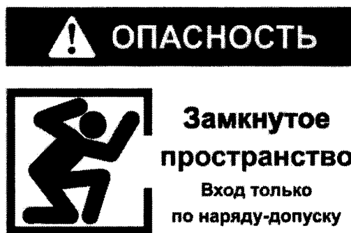
Рекомендуемый знак "ОЗП"

2. Объекты, вошедшие в Перечень 1 и не являющиеся территориально обособленными объектами, должны быть обозначены знаком "ОЗП" (рекомендуемый текст).